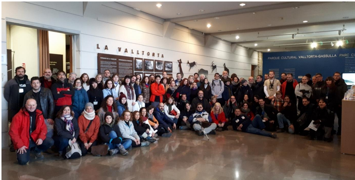
Alumnos participantes en el Seminario 2018 de guías de arte rupestre.