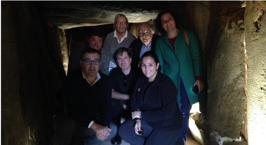
Ponentes de las Jornadas.